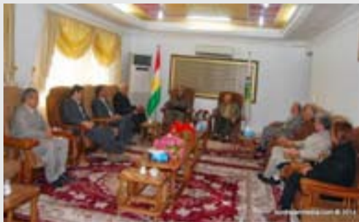
نیزیک بوونەوەی هیز و لایەنەکان کەوتە بەر باس. لە بەشێکی دیکەى ئەو هاوودیتنەدا، سکرێتێری گشتیی حیزب سەبارەت بە رۆلی

تیکدەرانی رژیمی ئیسلامی ئێران و رۆلی ئەو رژیمە لە ئالۆژیەکانی ناوچەکەدا هێنایە بەریاس. هەروەها دانیشتنی ئێران و گرووبی پینچ زیندە یەک و توندوتیژبوونی سەروکت و ئیعدامەکان لە ئێران پاش هاتنە سەرکاری رووحانی بەشێکی دیکە لە باسەکان بوو. لەو دانیشتنەدا چەندین بابەتی پێوەندیدار بە باروودۆخی کورد هاتە ئاراوه و لە کۆتاییشدا لەسەر بەرەوامی پێوەندیی دۆستانەیی نێوان هەردوو حیزب پێداگری کرایەوه.