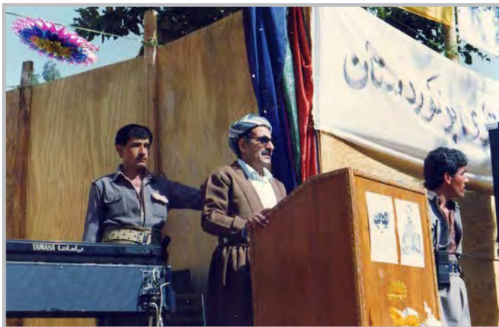
کاک جه لیل له ریوره سمی ۲۵ی گه لاویژدا