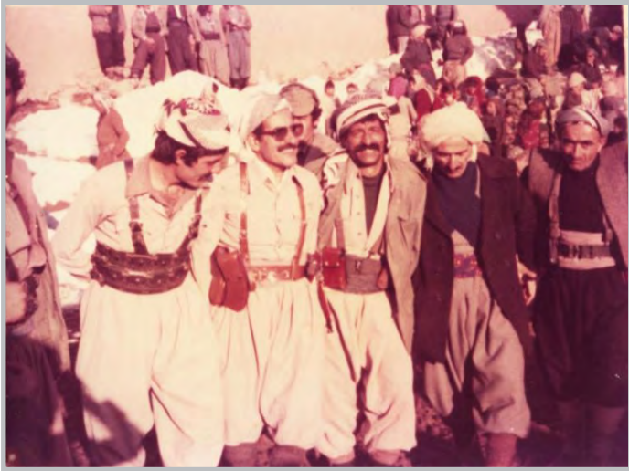
کاک جهیل له نټو کږي شايي و خوشي پيشمه رگه کانددا