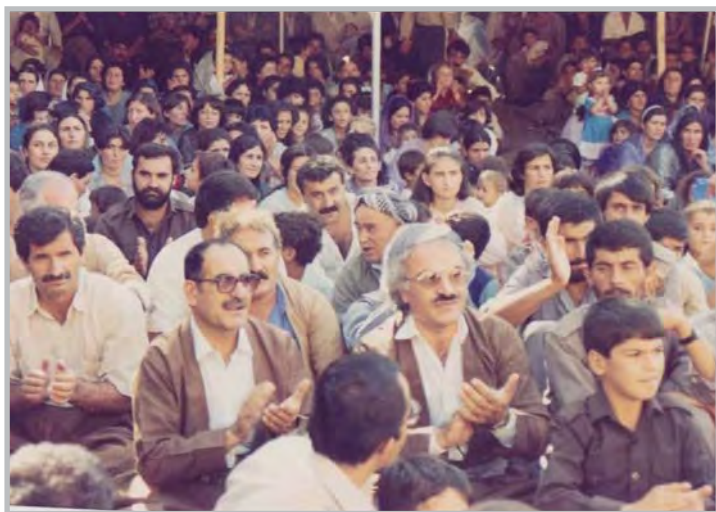
کاک جهلیل و هاوسه ننگه رانی - قه لاسه ییده