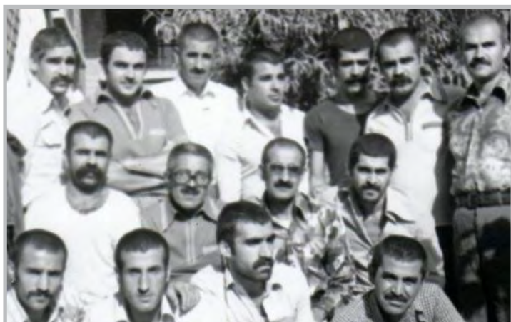
کاک جهلیل له به نندیخانه - سه رده می ریژی می پاشایه تی