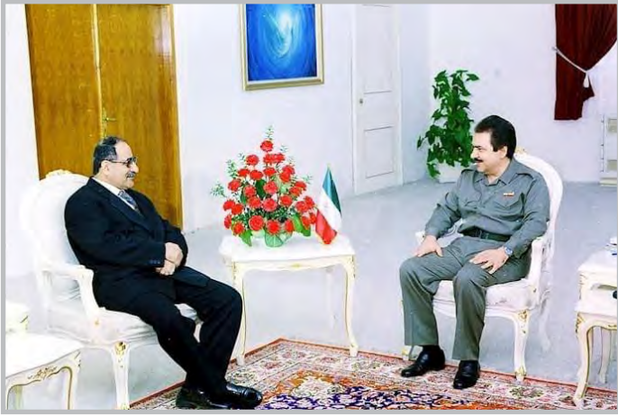
کاک جهلیل و مهسعوود ره جهوی