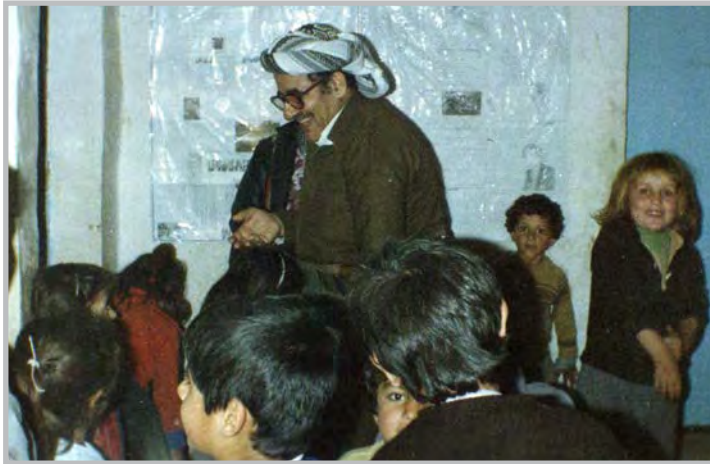
کاک جه لیل له نیو کۆری مندالانی شوڤرشدا