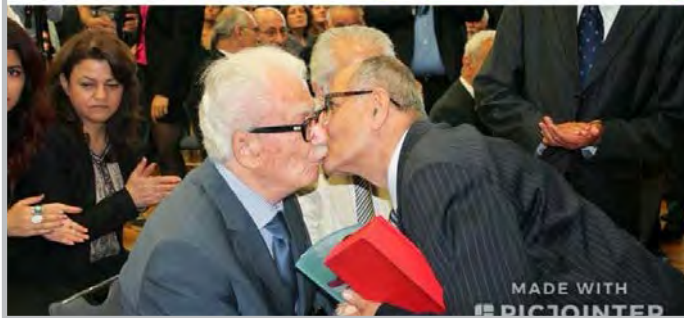
کاک جه لیل له ریپوهره سمی ریژگرتن له نه مر کاک سارمه دینی سادق وه زیری