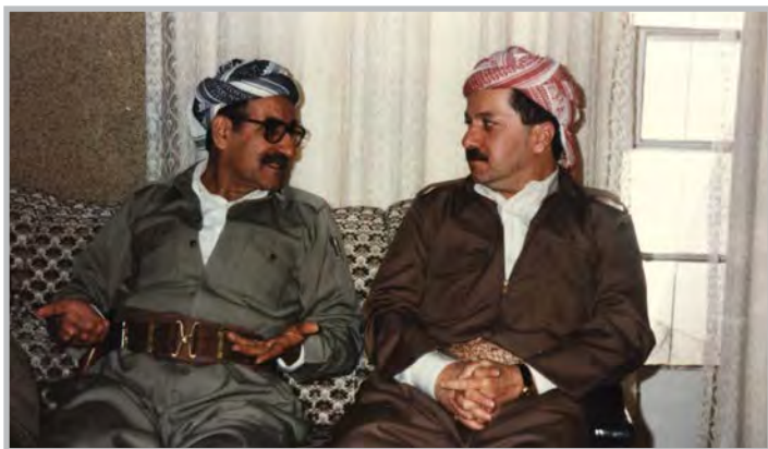
کاک مه سعوود بارزانی و کاک جهلیل