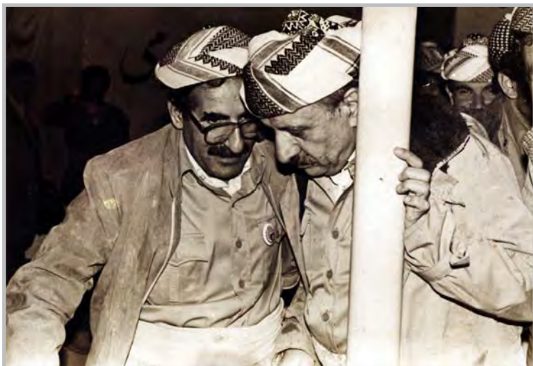
شههید دوکتور قاسملوو و کاک جهلیل