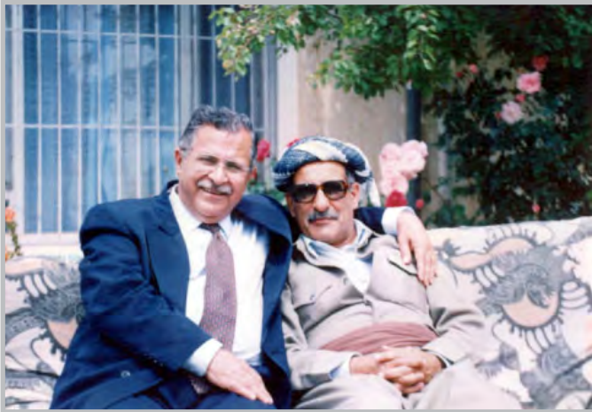
کاک جه لیل و مام جه لال