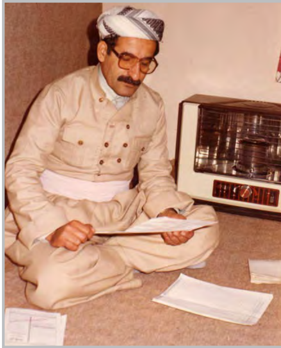
کاک جه لیل