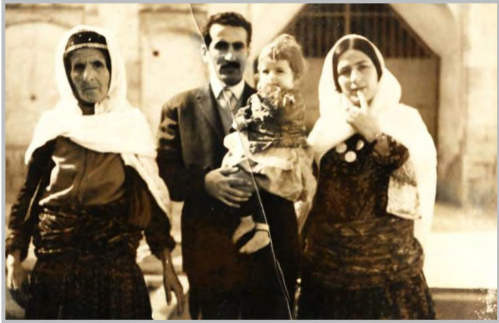
کاک جهلیل له گه‌ل دایکی و بنه‌ماله