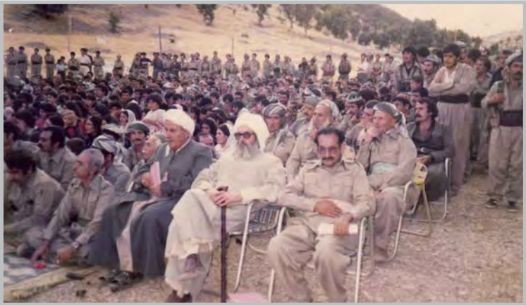
کاک جه لیل له پټوره سمی تاییهت به یادی ۴۰ ساله‌ی دامه‌زرانی حیرب - گهوره‌دی