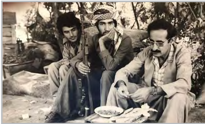
کاک جه لیل