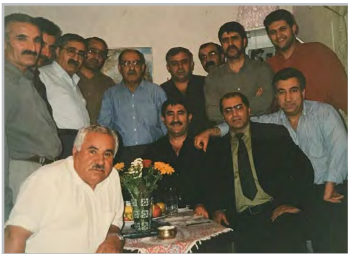
کاک جهلیل له نیو کۆری تیکۆشه رانی دیموکرات له دهره وهی ولّات