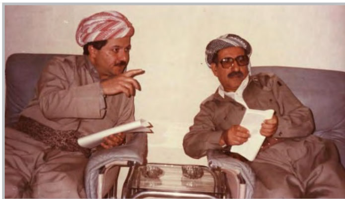
کاک جه لیل و کاک مه سعود بارزانی