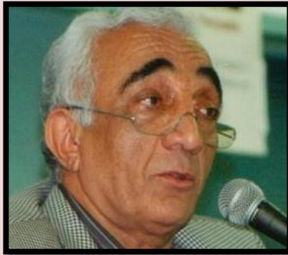
مه‌هدى خانبابا تیه‌رانى

به‌پروای من بزووتنهوهی کوردستان بۆ زۆر له دهسکهوتهکانی خۆی، قهرزدارى زانایى و زیرهکیى سیاسى قاسملوو به. نهو پاش ته‌واوکردنى خویندنى زانستگه له پاريس، سالانیهكى زۆر له چیکوسلۆواکى ژیاوه و پاش هاتنى میوانه نه‌خوازاوه‌کانى شوورپایى بۆ نهو، سالى ١٩٦٨ ناچار بوو نهو ولاته به جى بێت. قاسملوو له گه‌ڵ مه‌سه‌له‌کانى پێوه‌ندیدار به ولاتانى ئوروپایى ئاشنایه و ئاگای له بارودۆخ و سیاسه‌تى ولاتانى ناوچه‌ی رۆژه‌لاتى نیوه‌پراستیشه. ئینسانیهكى دنیا‌دیتوو به له‌راستى دا نه‌زموونى ده‌وله‌مه‌ندى نهو، یارمه‌تیی زۆرى به گه‌شه‌کردنى سیاسى حیزبى دیموکراتى کوردستانى ئێران کردوه.