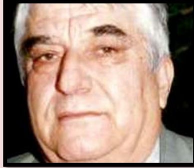
دوكتور عيزه دين مسته فا ره سوول

دوكتور قاسملو، كه سيكى هه لكه وتووى گه لى كوردو رۆژه لات.