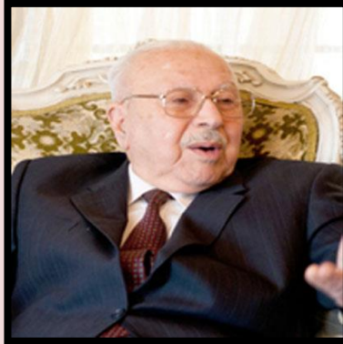
دوکتور موکه پرهم تاله بانی

دهمیک بوو دوکتور قاسملوو وهکوو خهباتکه ریکی کورد دهناسی، بهلام که له هشتاکان دا بو نوابژی کردن له نیوان حکومهتی عیراق و پارتیه نیشتمانی یهکان و بهتایبهت پارتیه کوردستانی یهکان (یهکیهتی نیشتمانی کوردستان و پارتی دیموکراتی کوردستان و پارتی کومونیستی عیراق) بو دۆزینهوهی ریگای ناشتی بو چارهکردنی کیشهی کوردی کوردستانی خواروو، چهند جاریک له بهغدا له گهه شهید د . قاسملوو یهکترمان بینی ههر دووک لهو بروایه دا بووین که ده بیته کیشهی کورد به جوړیکی ناشتی یانه چاره بکریته، هه لگیرسانهوهی شهه له کوردستان دا ده بووه هو ی دهر د و نهشکه نجه یهکی زوری میلهته تی کورد و، ته نهها سوودی بو دۆزمنانی کورد و عهره ب بوو.