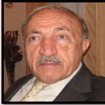
دوکتور مەحموود عوسمان

ئەبەر ئەوھەری کە نزیکەھەری سێ دەھە پێنۆھندی نێزیکەھەری ھەبوو، ئە گەئ شەھید د. قاسملوو دا و تا رادەھەک شارەزای بیرورا و بۆچوونی بووم بە پێنۆستی ئەزانم بەبۆنەھەری تێپەرپوونی دە ساڵ بەسەر شەھیدکرانی دا زۆر بە کورتی ئاماژە بۆ ئەم خالانەھەری خواروھەری بکەم دەربارەھەری، کە زیاتر لایەھەری جۆری بیرکردنەوھەری و خەباتی ئەم تێکۆشەرە ناسراوھەری گەھەری کورد دەرنەخەن بۆ ئەوھەری زیاتر ئەم کەسایەتیھە ئە لایەن نەتەوھەری کەمانەوھەری بناسریت: