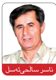
ناسەر سەڵحی ئەسەل

هەلبژاردن لە کۆماری ئیسلامیدا جیا لە بەکارهێنانی خەڵک بۆ وەرگرتنی دەنگی مەشرووعییەت بۆ ریژیم، نەک هیچ ئاکام و قازانجیکی بۆ گەلانی ئێران نایه، بەلکۆ دەزایەتی لێگەڵ بەرزەوه‌ئەندی و