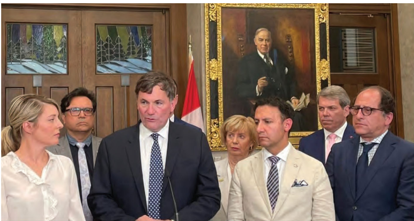
کانادا: له ئیستاوه سپای پاسداران بهرهمی به ریکخراویکی تیروۆریستی دهناسین